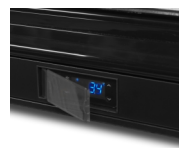
Skyddshölje på termostat